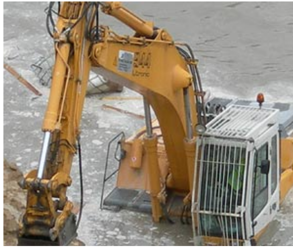
La riada arrastró hasta el material más pesado (Eduardo Robles)