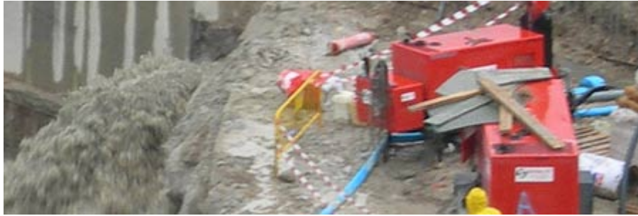
La rotura de un dique provocó la entrada del agua en las obras (Eduardo Robles)