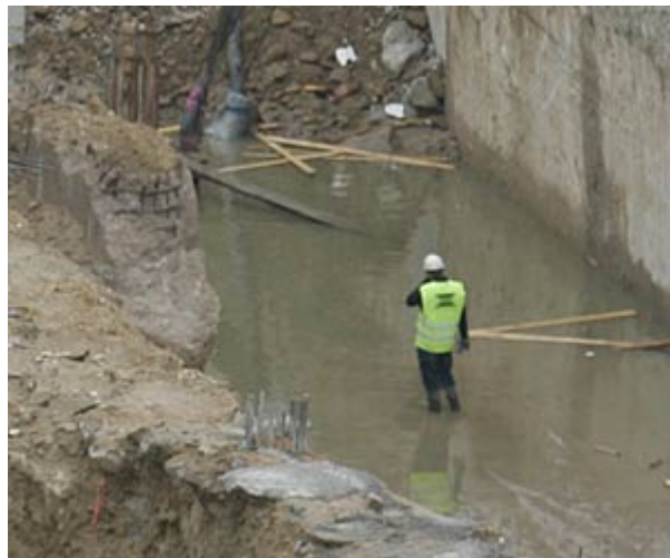
Aunque las obras han vuelto a la normalidad, hay zonas permanecen inundadas (Jorge París)