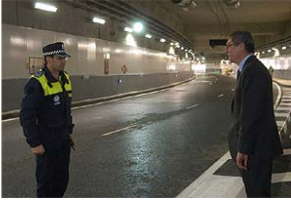
Gallardón charla con un policía durante la inauguración del túnel.

Actualizado viernes 20/04/2007 18:46 (CET)