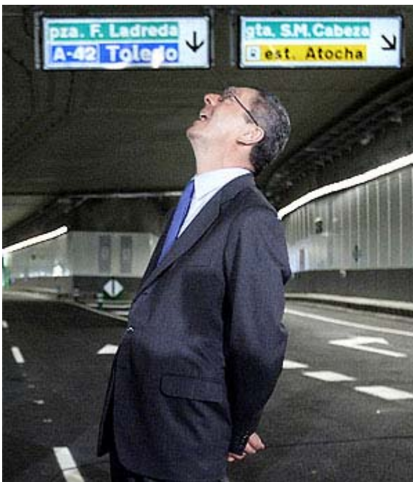
Gallardón observa el túnel durante la inauguración.

Actualizado martes 20/02/2007 18:10 (CET)