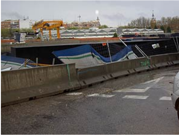
Chimenea del túnel de la M-30. Estructura de hormigón.