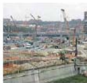
En el Constanorio lo critican.

Impedir la entrada no es una solución. Qué! ya comprobó el pasado 2 de junio cómo varios vecinos de la ribera del Manzanares aseguraban, con partes médicos como pruebas, que el polvo de las obras de la M-30 les producían enfermedades respiratorias y oculares. De esta forma, velan limitada su vida cotidiana.