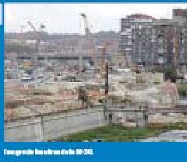
Imágenes de las obras de la M-30.

Las obras de la M-30 perjudican la vida diaria de los vecinos. Están a la espera de la indemnización a la que han llegado los eurodiputados que visitaron las obras el pasado mes de julio.