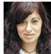
Los vecinos dicen verlas a menudo.