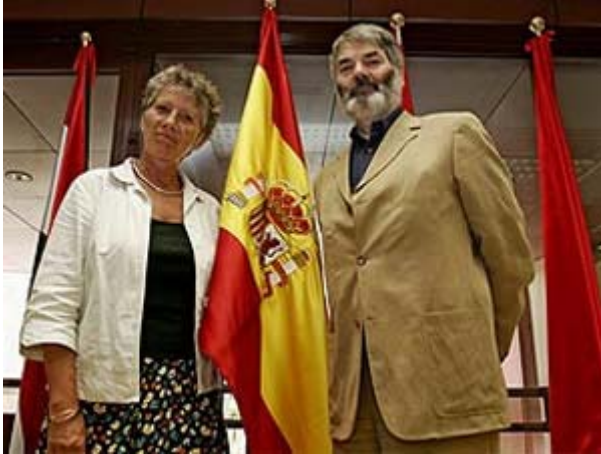
Los eurodiputados Margarete Auken (izda.) y Proinsias de Rossa.