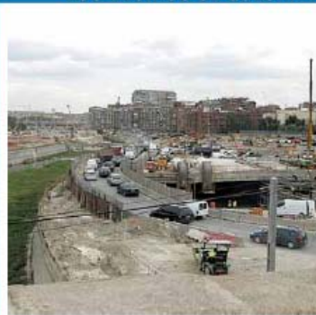
Las obras de la M-30 destruyen el hábitat de miles de roedores.