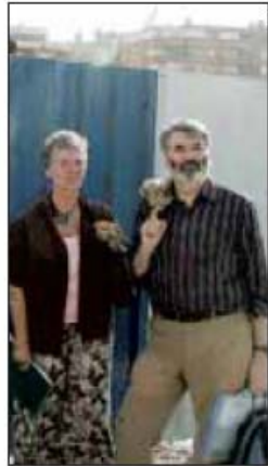
LA DELEGACIÓN europea visitó las obras en junio.

Sus conclusiones fueron deplorable. A juicio de Proinsias, las obras que vio son "gigantescas y de una gran envergadura", por lo que es im-