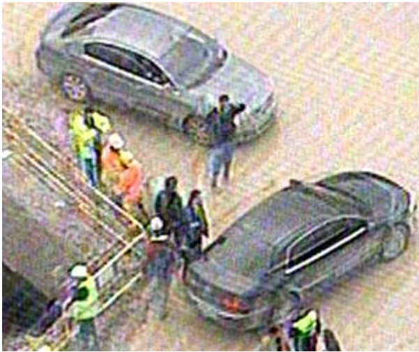
Imagen de la comitiva en la que ha llegado el alcalde Ruiz-Gallardón hasta el lugar de los hechos