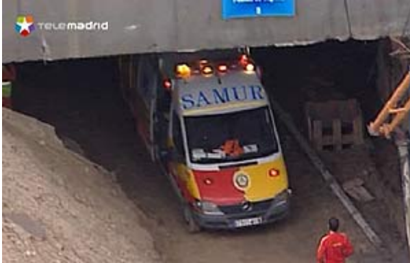
Una ambulancia en la boca del túnel.