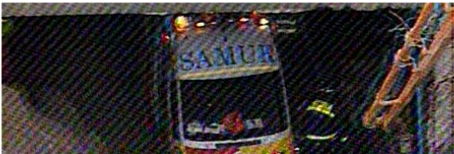
El túnel donde ha ocurrido el accidente