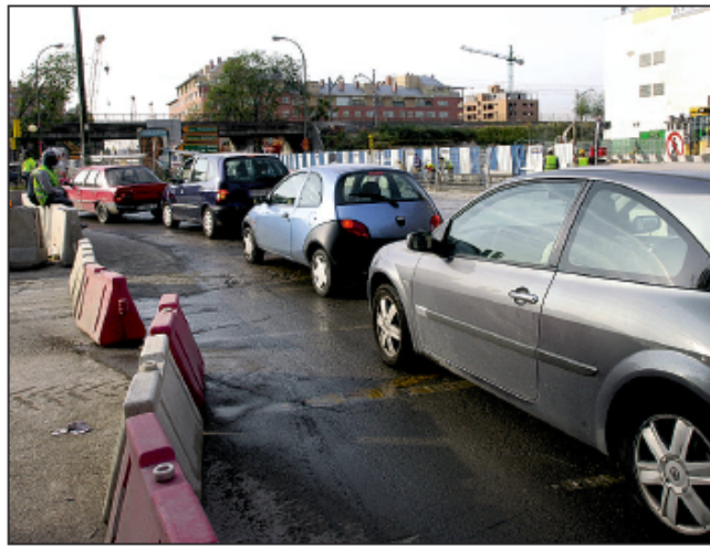
Los vecinos de la Plataforma de Afectados por el Nudo Sur denuncian que el corte de la calle de Embajadores ha supuesto nuevos problemas para el tráfico en la zona y los residentes del entorno.

Hay que señalar que el corte repercute directamente a los vecinos que desde Legazpi quieren acceder a la M-30 y a aquellos que salen desde la carretera de circunvalación hacia el barrio. A los primeros, el corte les obliga a hacer una especie de "U" al llegar al corte de Embajadores -a la altura de la calle de Bronce- para volver a salir, coche a coche, a