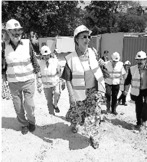
Los eurodiputados en un momento de su visita a las obras de la M-30

Al margen de las conclusiones de ayer, el primer informe de su visita se presentará de forma oral, ante la Comisión de Peticiones del Parlamento, el 10 de julio. Para plasmar la recomendación por escrito habrá que esperar hasta septiembre.